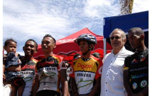
» UNMIT Photo/ Bernardino Soares