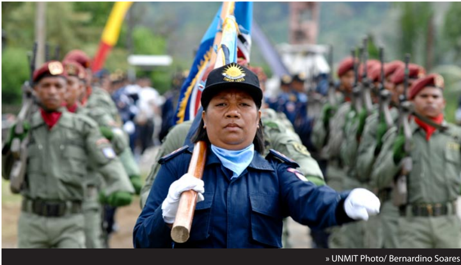
» UNMIT Photo/ Bernardino Soares

D urante fulan-Setembru, Polísia Nasionál Timor-Leste (PNTL) simu hikas fali knaar responsabilidade primária polisiamentu nian iha distritu hirak hanesan; Likisá, Ermera, Aileu, no Manufahi nune'e mós hosi Departamentu Imigras-aun, Unidade Patrullamentu Fronteira, no hosi Eskritóriu Interpol nian. Ne'e hanesan parte ida hosi simu hikas fali responsabilidade primária polisiamentu nasionál nian iha distritu hotu-hotu no iha unidade polisiais nian.