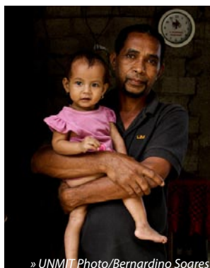
» UNMIT Photo/Bernardino Soares

Sura populasaun Timoroan ida-ida, inklui ba rezidente estranjeiru no turista-sira, sei kontinua to’o loron 25 fulan-Jullu. Dadus ne’ebé mak halibur tiha ona durante Sensus 2010 ne’e sei fornese ba Governu Timor-Leste no ninia parseiru dezenvolvimentu sira ho atualizasaun ida ne’ebé mak nesesariu duni ba demografia país nian, hanesan mós instrumentu nesesariu ba planeamentu no implementasaun ba política públiku nian no programa dezenvolvimentu ne’ebé mak adekuaudu no realístiku.